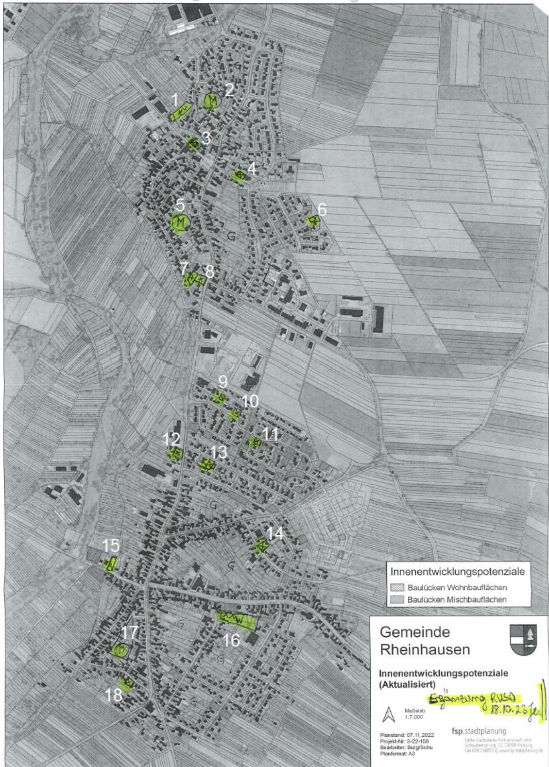
Abbildung: Verortung weiterer Innenentwicklungspotenziale – Ergänzung RVSO (18.10.2023)